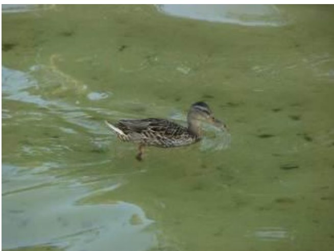
Шорина Карина 5 «Б»

Мне очень понравилось отдыхать на Белом озере. Я бы хотела на следующий год отдохнуть еще на Белом озере.