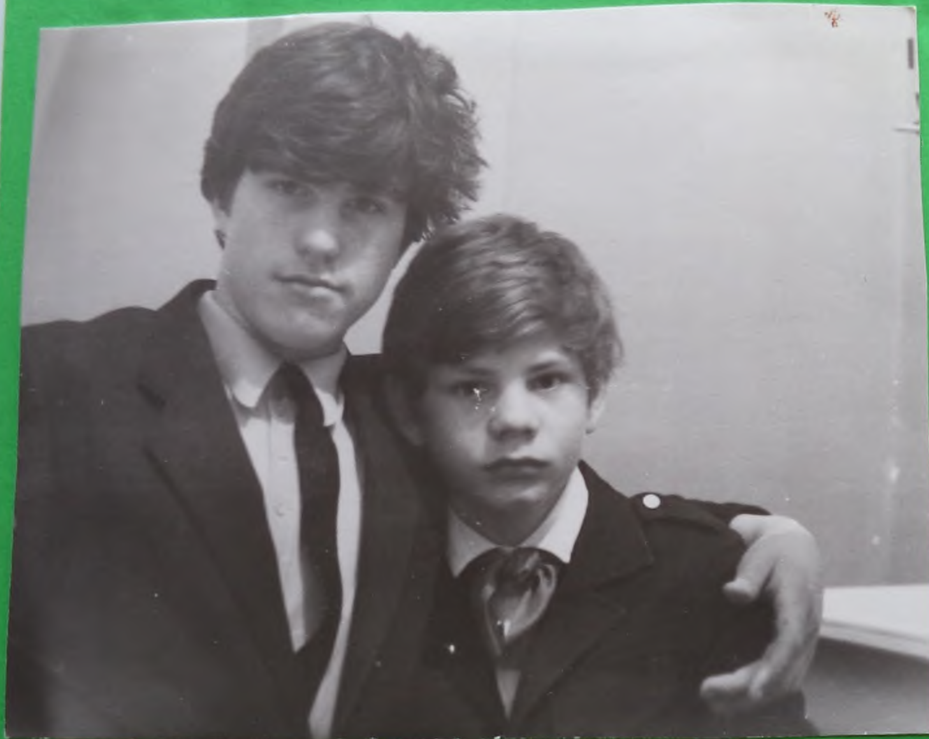
Вот какие мы были.