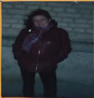
ЗАКОНЧИЛА КУЗНЕЦКОЕ МЕДИЦИНСКОЕ УЧИЛИЩЕ. РАБОТАЕТ МЕДСЕСТРОЙ В ДЕТСКОЙ ПОЛИКЛИНИКЕ.