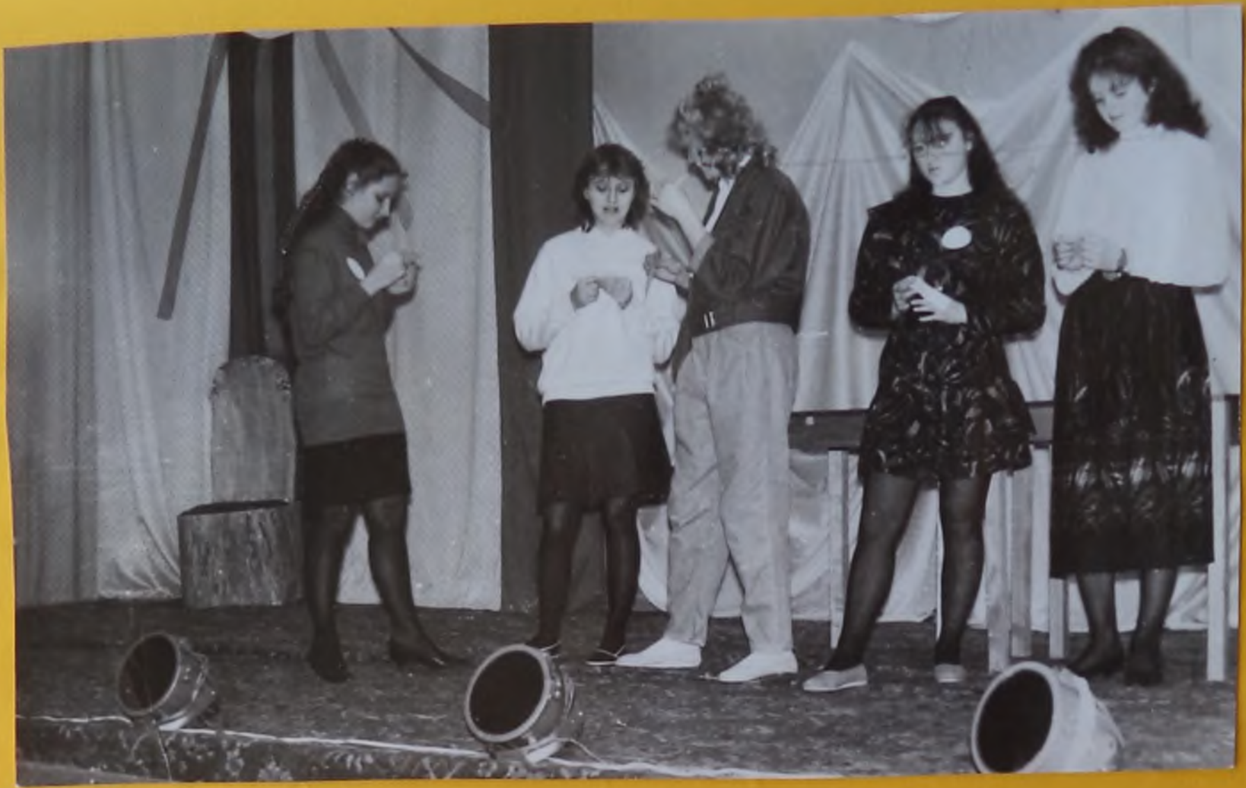
Мы и пляшем и танцуем