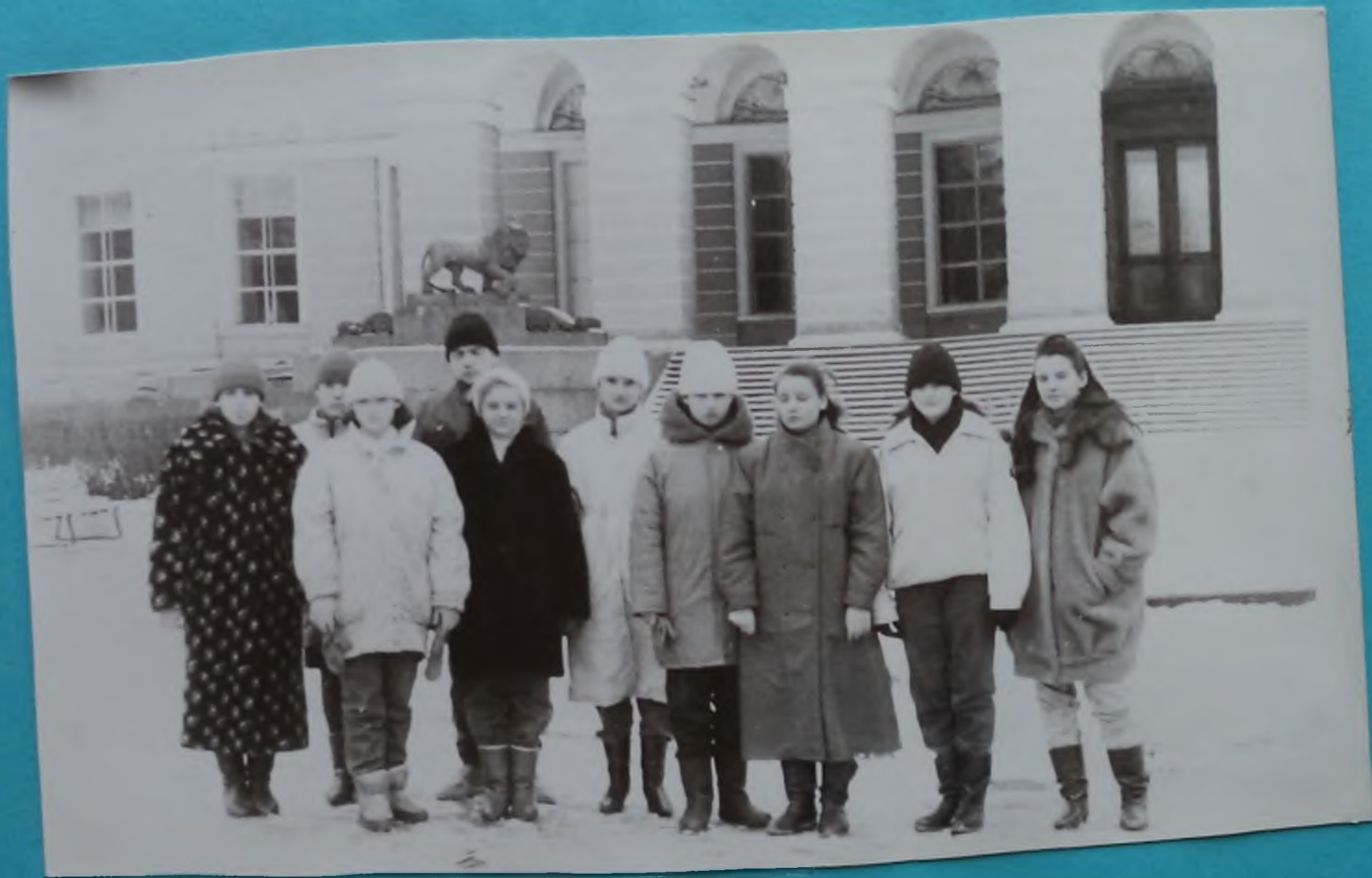
Поездка в музей