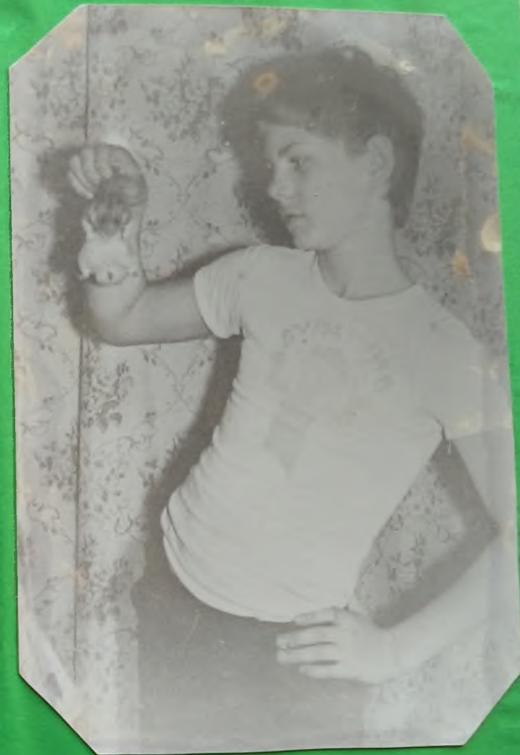
Что за зверь?