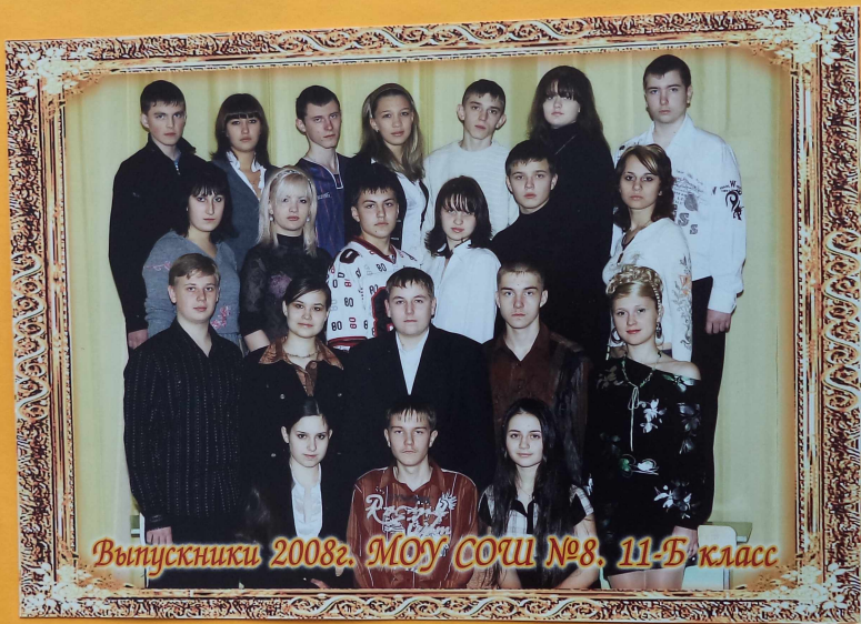
Выпускники 2008г. МОУ СОШ №8. 11-Б класс