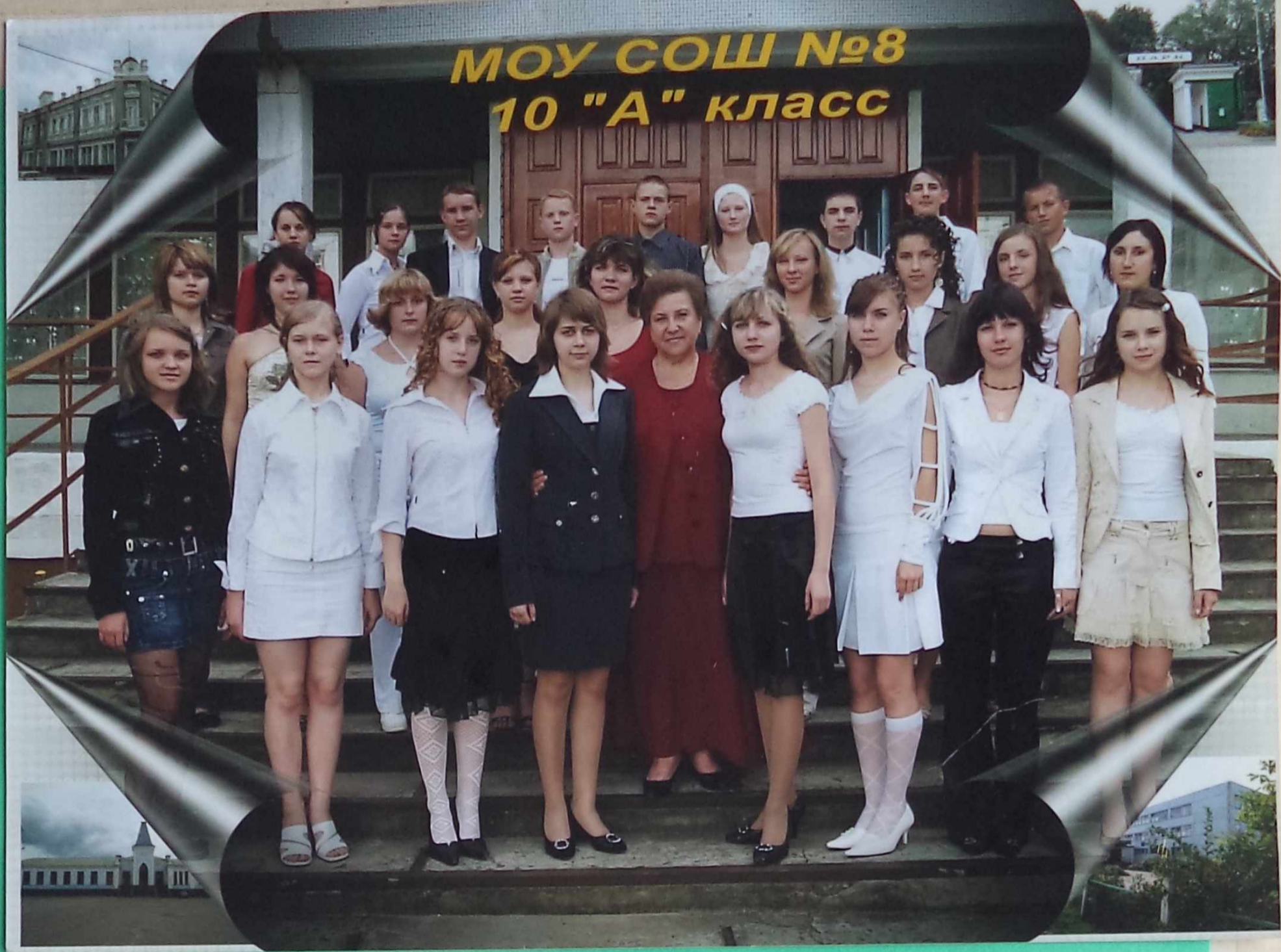
11 «А» класс...