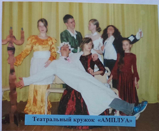
Театральный кружок «АМПУГА»