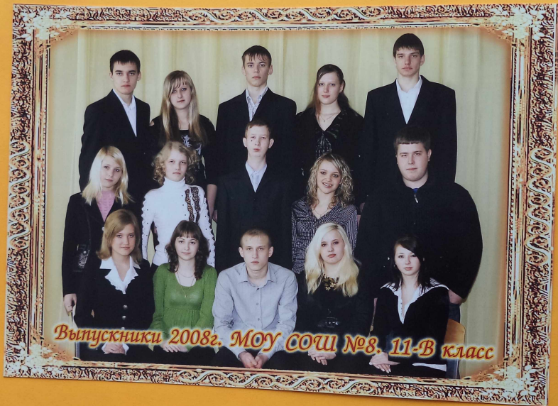
Выпускники 2008г. МОУ СОШ №8. 11-В класс