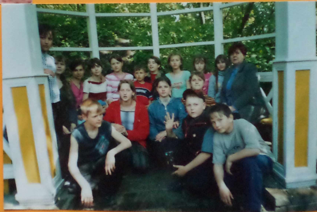
Веселая поездка в Тарханы