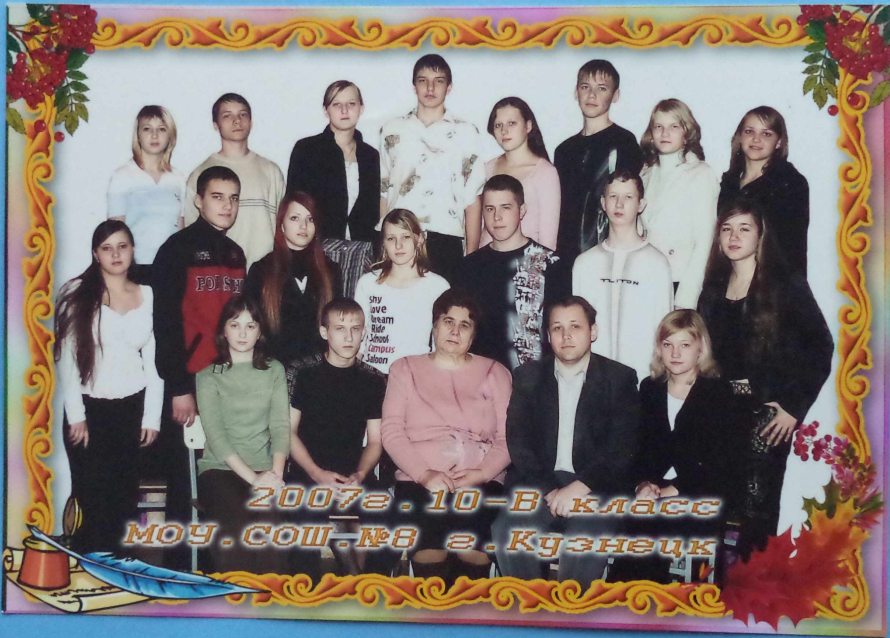
2007г. 10-В класс МОУ.СОШ.№8 г. Кузнецк